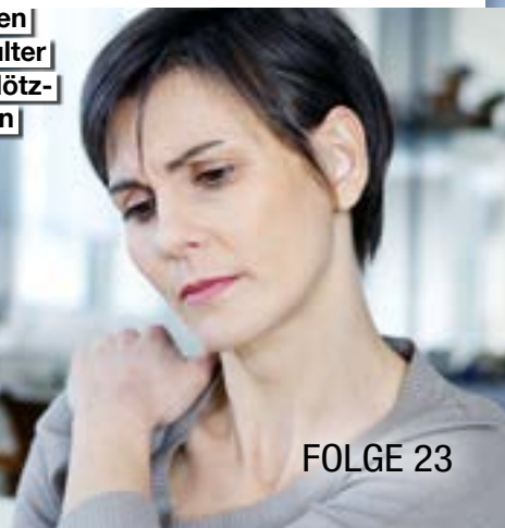
Die Schmerzen einer Kalkschulter können ganz plötzlich auftreten

Diese weichteiladaptive Hyaluronsäure bildet dann einen sogenannten Fibrinkomplex und kann dadurch sehr effektiv gegen Entzündungen vorgehen – und den Heilungsprozess beschleunigen.“