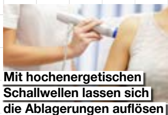
Mit hochenergetischen Schallwellen lassen sich die Ablagerungen auflösen

„Zunächst wird versucht, die Kalkschulter (lat. Tendinosis